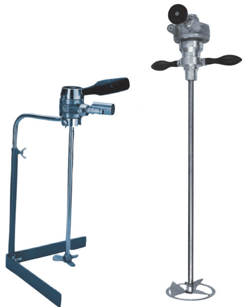
Kleingebinderührwerk bis 20 l, Großgebinderührwerk bis 60 l

Als Antrieb dienen sowohl elektrische Motoren als auch druckluftangetriebene Motoreinheiten. Die Geschwindigkeiten werden durch Untersetzungsgetriebe und/oder Reglereinheiten beeinflusst.